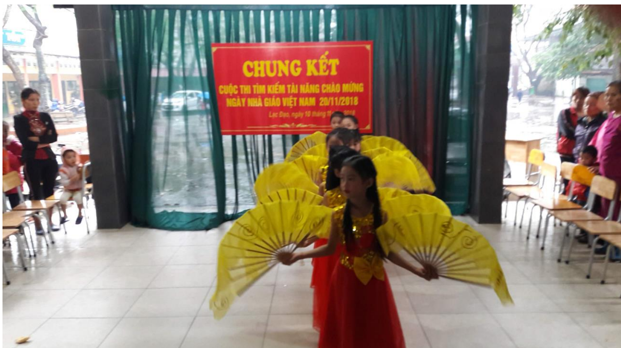
Phụ huynh hỗ trợ các em học sinh trang điểm và biểu diễn văn nghệ chào mừng ngày Nhà Giáo Việt Nam ( 20/11/2018)