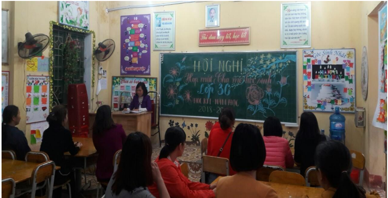
Hình ảnh cuộc họp phụ huynh lớp 3C- Kì 1 năm học 2018- 2019