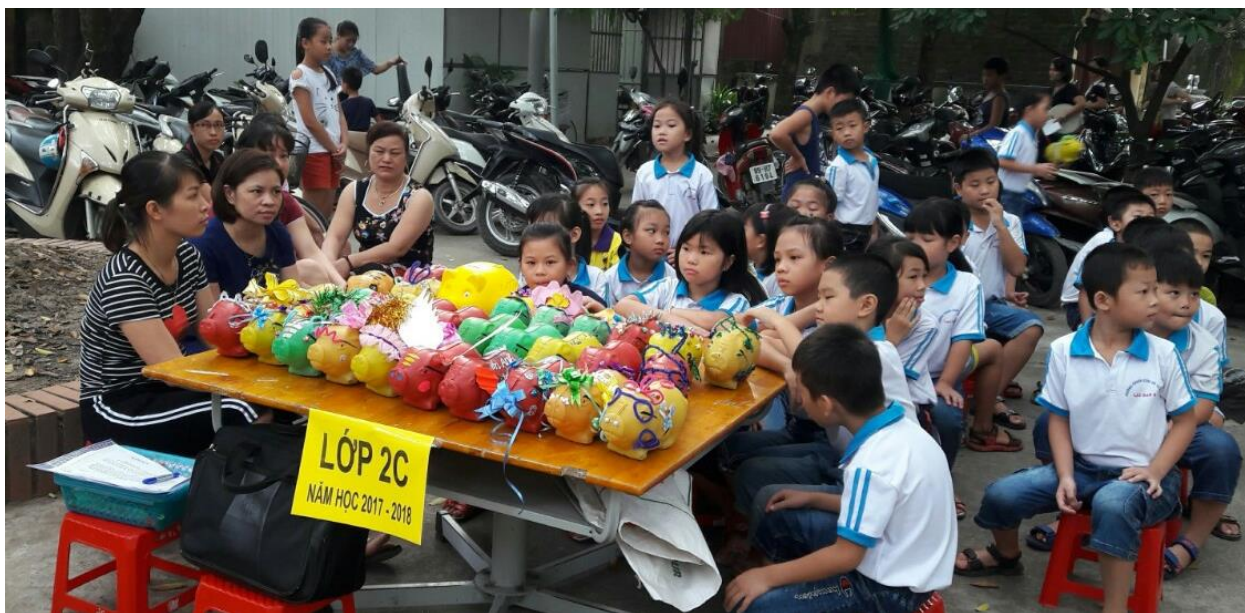
Phụ huynh hỗ trợ Giáo viên và các em học sinh tham gia Ngày hội mô lợn nhựa tiết kiệm (Tháng 8/2018)